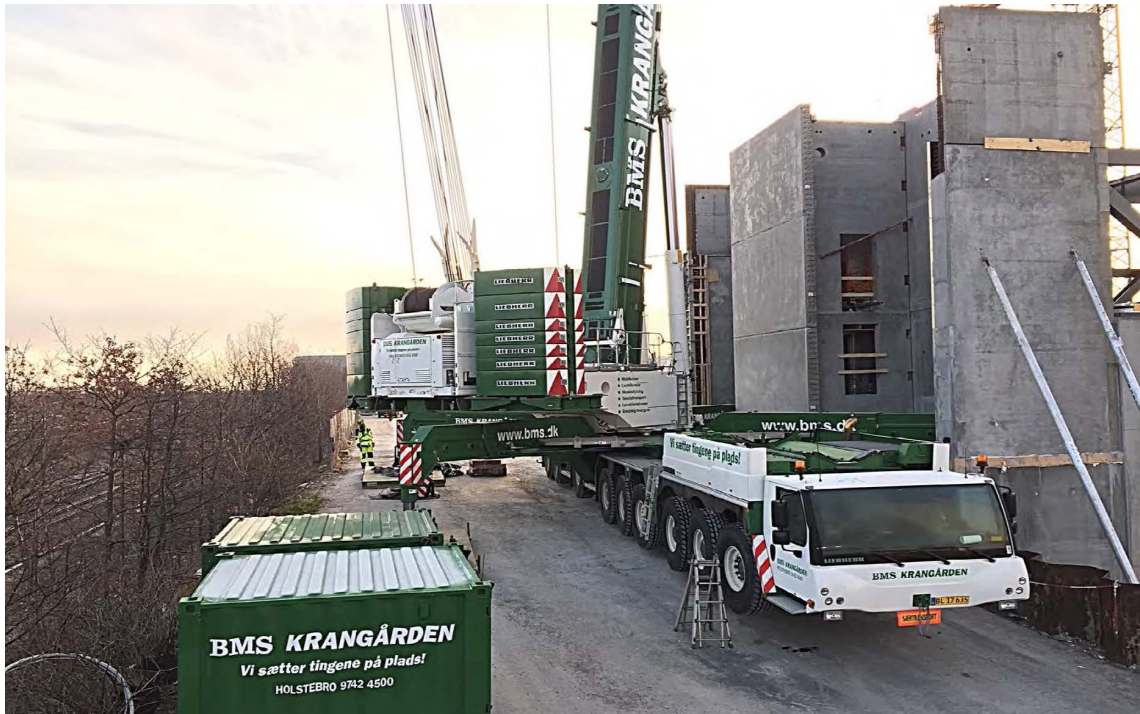
LAURÉAT DU PRIX ESTA 2020 GRUES : TÉLESCOPIQUES, CAPACITÉ SUPÉRIEURE À 120 TONNES - BMS