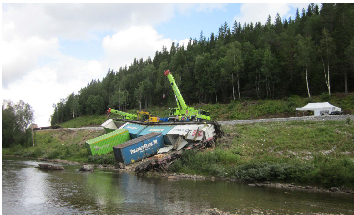
LAURÉAT DU PRIX ESTA 2020 GRUES : TÉLESCOPIQUES, CAPACITÉ INFÉRIEURE À 120 TONNES - KYNINGSRUD NORDIC CRANE

Si leur candidature est acceptée, ils rejoindront les centres de formation déjà en exercice: Mammoet aux Pays Bas, EUC Lillebælt au Danemark et Liebherr en Allemagne.