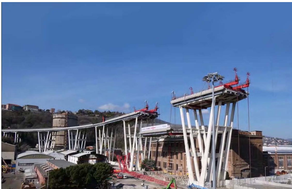
LAURÉAT DU PRIX ESTA 2020 TECHNIQUES COMBINÉES ET SPMT - FAGIOLI